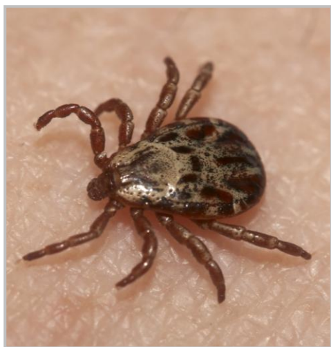
Луговой клещ рода Dermacentor

В северной подзоне области, на территории Александровского, Верхне-Кетского, Каргасокского районов и г. Стрежевого, где ежегодно происходит 200-300 случаев присасывания клещей, наблюдается спорадическая заболеваемость КИ (1-3 случая в год). В средней подзоне, в Бакчарском, Колпашевском, Кривошеинском, Молчановском, Парабельском, Первомайском, Тегульдетском и Чаинском районах, а также в г. Кедровый за год регистрируется от 2 500 до 3 000 случаев присасывания клещей и наблюдается низкий уровень заболеваемости КИ (2-6 случаев в год). В южной подзоне, в Асиновском, Кожевниковском, Томском и Шегарском районах риск заражения КИ наиболее высок. На долю этих районов приходится от 70 до 86 % случаев присасывания клещей и заражений инфекциями.