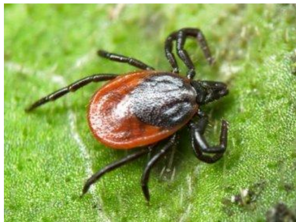
Таежный клещ рода Ixodes

На сегодняшний день клещевые инфекции стали проблемой крупных населенных пунктов. В Томской области это касается, прежде всего, территории г. Томска и его рекреационной зоны, где обитает два плохо отличимых друг от друга вида иксодовых клещей ( Ixodes ): таежный и клещ Павловского. В последние годы возросла численность ещё один клеща – лугового, принадлежащего к роду Dermacentor , который имеет два пика активности – весенний (май-июнь) и осенний (август-сентябрь). Ввиду экологических особенностей клещей и различий в их биологии случаи присасывания наблюдаются в несвойственных ранее местах – в парках, на придомовой территории, на спортивных и детских площадках и т.п.